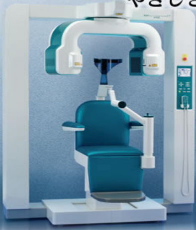
X線CT装置3DXマルチイメージマイクロCT

新世代のデジタルX線センサー「フラットパネルディテクタ(FPD)」を搭載し、少ない線量で高品質画像を提供します。