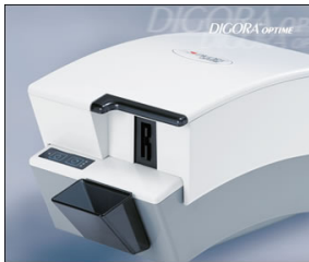
ディゴラオブティメ