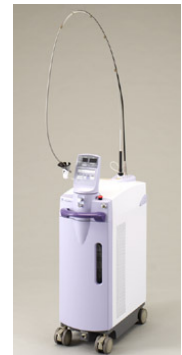
アーウィンアドバール